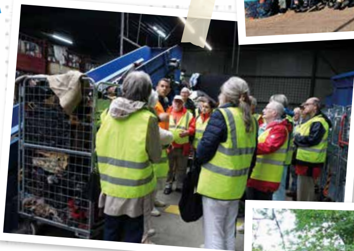
Visite du Parcours WAW avec la section de La Woluwe.