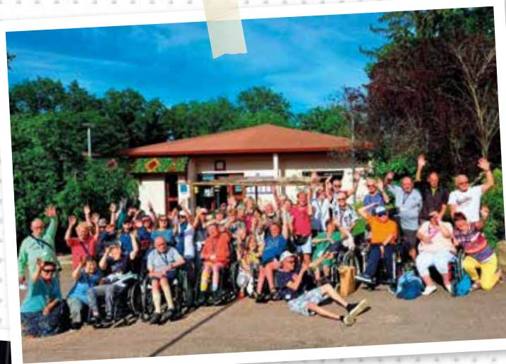
Séjour en Bourgogne organisé par la régionale début du mois de juin.