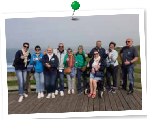
Groupe des volontaires séjour