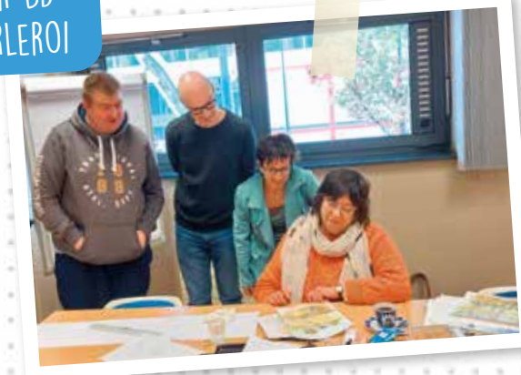
ATELIER BD À CHARLEROI