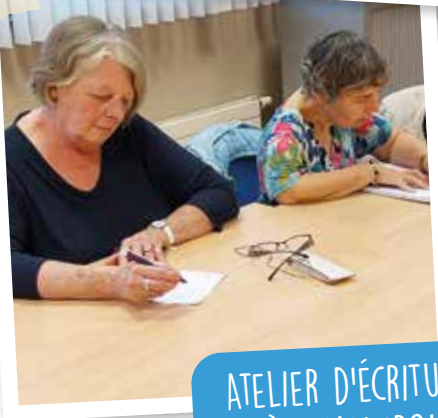
ATELIER D'ÉCRITURE À CHARLEROI