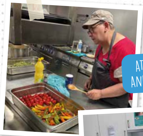
ATELIER CUISINE À ANDERLUES ET STRÉE