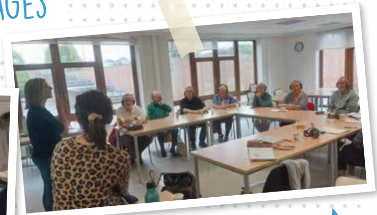
FORMATION : IMMERSION DANS LE MONDE DE LA SURDITÉ