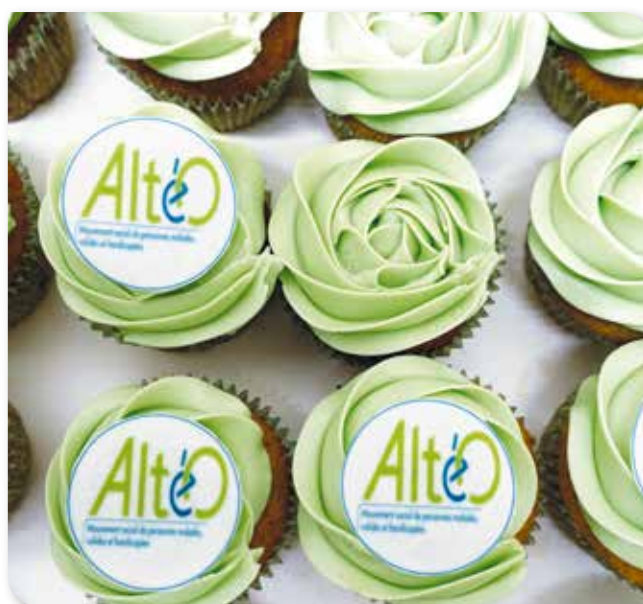
Cupcakes réalisés par Cinthya

INSCRIPTION SOUHAITÉE: 081/237.237 ou genevieve.bary@alteoasbl.be