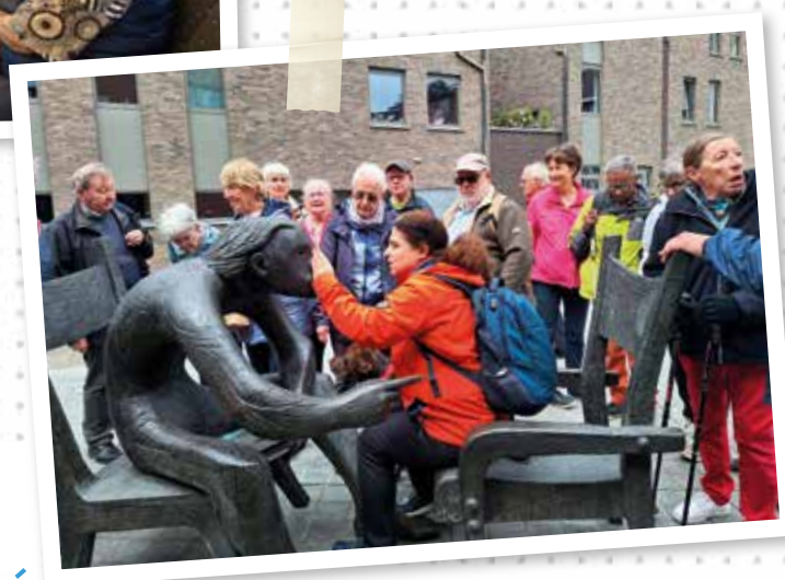
Escapade à Alost avec le groupe Altéo Culture.