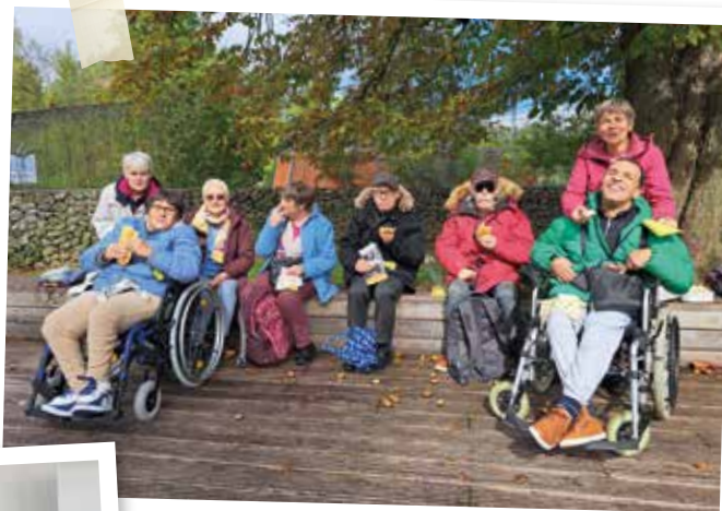
Les Galopins bourlinguent à Huizingen.