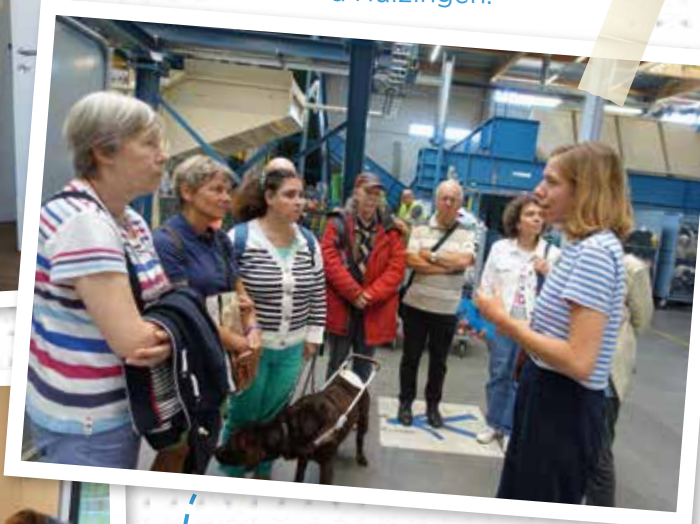
Visite des «Petits Riens» dans le cadre de notre projet écologique.