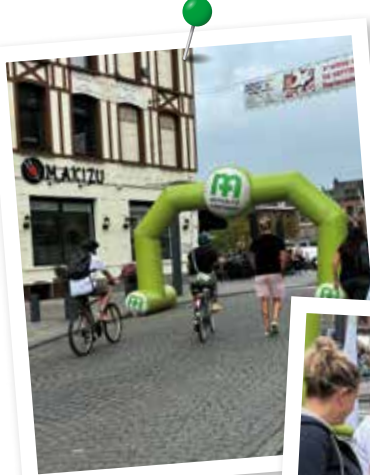
Une chouette journée pour tous sans voiture