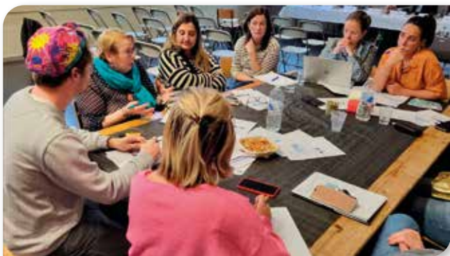
Des échanges sereins autour des tables de Brunehaut...