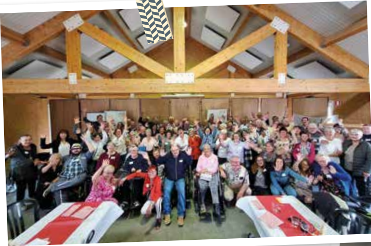
La convivialité typiquement Hainaut-Picarde!