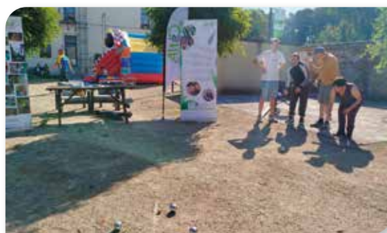
une partie de pétanque inclusive

Altéo Mons avait un stand dans le village des associations. On