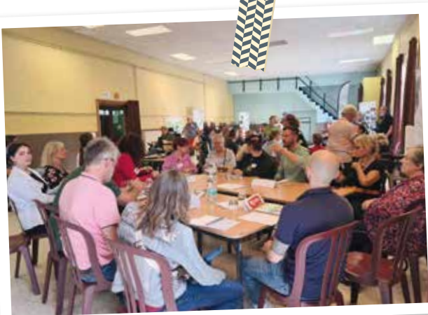
3 tables de discussion bien remplies

Le 5 septembre, Altéo Mons a organisé une soirée de discussion où les candidats aux élections communales ont pu dialoguer directement avec des représentants d'associations spécialisées dans le handicap. L'objectif? Placer les PMR au cœur du débat public.