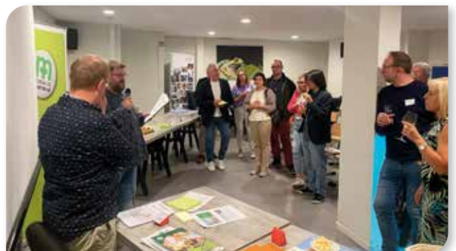
Toutes les tables terminent par un verre de l'amitié, avec les conclusions sur Comines