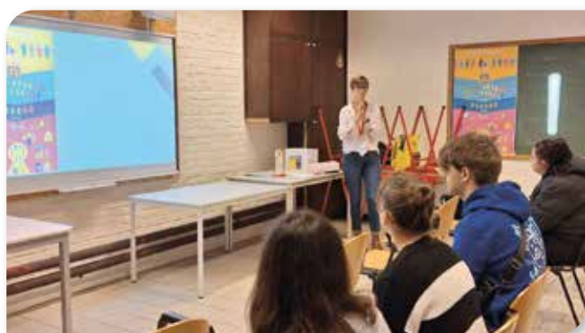
Animation à l'importance du vote dans l'ETA « Trait d'Union » à Mouscron

En Belgique, le vote est une obligation. Encore faut-il que tous les électeurs convoqués puissent honorer cette obligation. Tout un chacun mesure l'importance de l'expression du suffrage, acte citoyen fondamental et essence de démocratie. Cet acte civique essentiel doit pouvoir être accompli par tout citoyen remplissant les conditions requises, en ce compris par celui ou celle se trouvant au moment du scrutin de manière temporaire ou à long terme devant une difficulté à exprimer son vote et nécessitant des procédures et/ou un environnement adapté à cette situation.