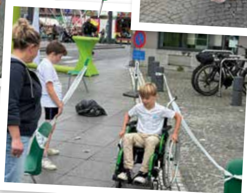
Les enfants ont également pu se tester au parcours mis en place

Merci à Qualias qui nous a fourni des chaises roulantes adaptées aux jeunes enfants