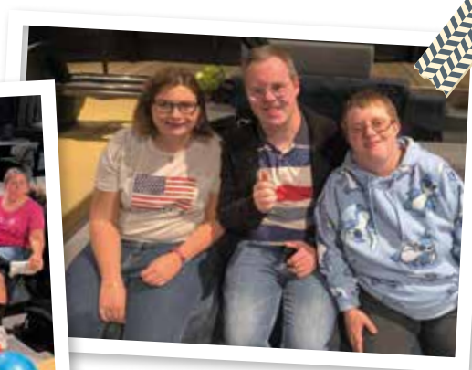
La convivialité du groupe, perçue en une seule photo