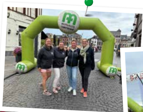
L'équipe au complet pour cette journée

Merci à Qualias qui nous a fourni des chaises roulantes adaptées aux jeunes enfants