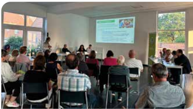
Présentation du fonctionnement des tables à Ellezelles

En vue des élections communales du 13 octobre, la MC a choisi de placer la santé au cœur de quatre communes du territoire Hainaut Picardie. L'occasion de rencontrer les têtes de listes des différentes communes autour de « tables rondes ».