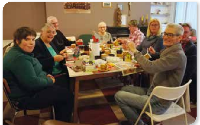
Qui s'est vite étoffé...

C'est ainsi que la «clique d'Enghien» se rassemblait une fois par mois autour d'un Uno endiable, une création inspirée et une bonne tasse de café. Un groupe hétérogène où plus jeunes et plus âgés, personnes valides ou en situation de handicap trouvaient leur place. L'un des objectifs d'Altéo: créer du lien social, était donc bien atteint.