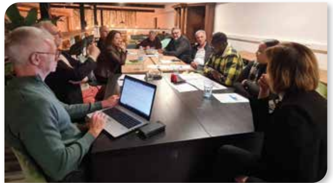
... et pareil du côté de Frameries

L'équipe d'animateurs Altéo Hainaut-Picardie