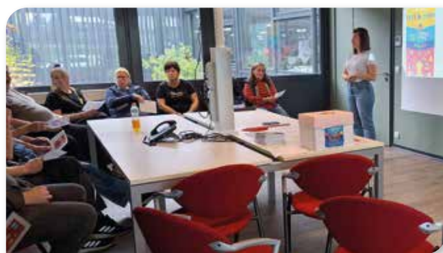
Animations à l'importance du vote à l'école « Le Tremplin » à Mouscron

Dans le cadre des élections communales et provinciales de 2024, Altéo et les services communaux, Pôles de l'Égalité des Chances et Affaires Sociales et Santé (Handicontact), ont proposé des sessions de sensibilisation sur l'importance du vote et de l'inclusivité démocratique.