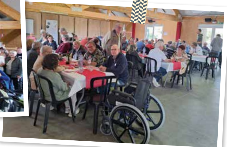
Merci à tous de votre présence et d'avoir rendu cette journée radieuse

Cette année, le samedi 14 septembre, a été une journée radieuse où nous avons pu exprimer notre reconnaissance envers nos volontaires. Plus de 80 personnes se sont jointes à cette célébration, unies par un même sentiment de solidarité et de gratitude.